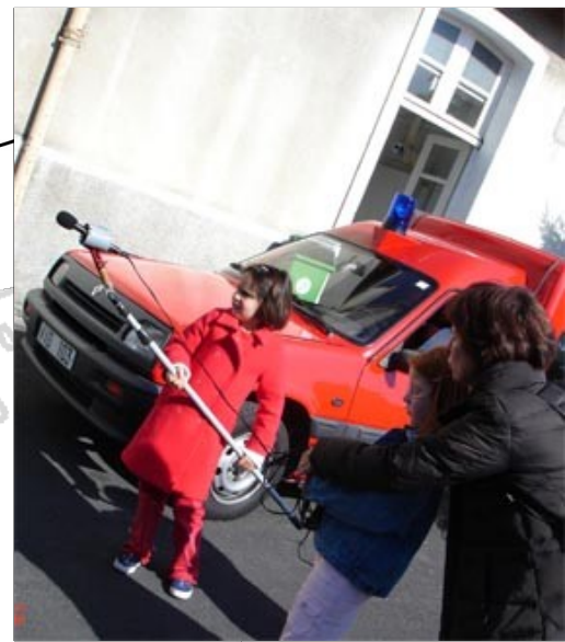
À la caserne de pompiers de St Maur, projet « les sons de la ville »

Les projets que propose Écophylle s'inscrivent dans une perspective d'éducation partagée et sont l'un des moyens possibles pour donner corps à des actions d'éducation et de sensibilisation à l'environnement urbain dans une volonté de développement durable.